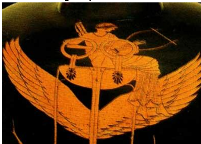
Imagem Apolo tocando lira

Detalhe de ânfora ática, século 5, acervo Museu do Vaticano.- Veja mais em https://educacao.uol.com.br/disciplinas/artes/musica---origem-sons-e-instrumentos.htm?tipo=3&cmpid=copiaecola